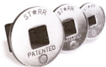
SA-10-03 Starr Socket Adaptors

Parte SA-1003 Kit de adaptadores 1/4", 1/2" y 3/4" Para uso industrial en trabajos pesados